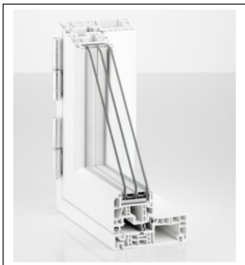
Snit i PVC vindue.