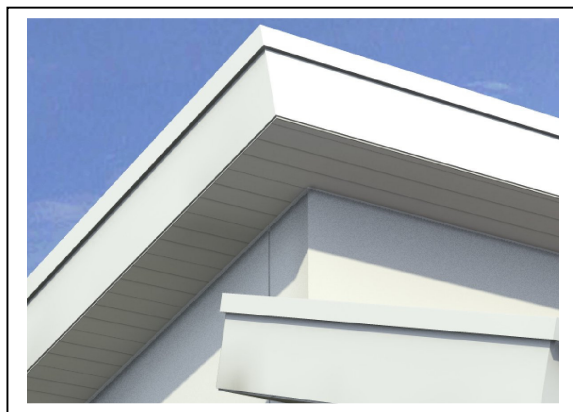
Tagudhæng med inddækning.